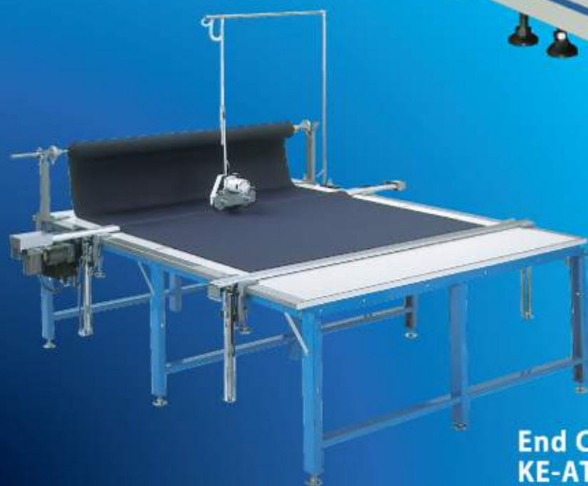
End Cutter KE-ATU