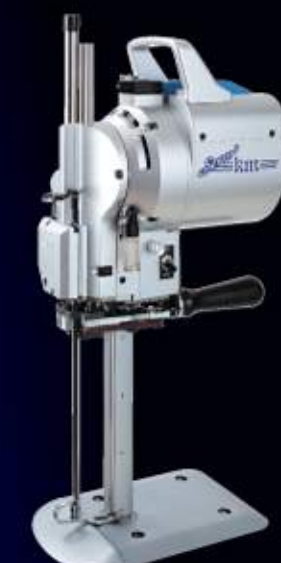
Servo Cutter KM-SV