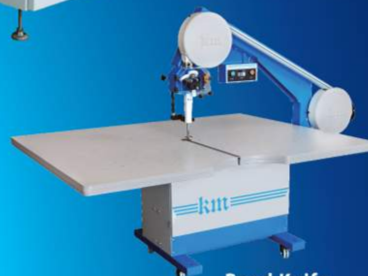
Band Knife KBK-900M