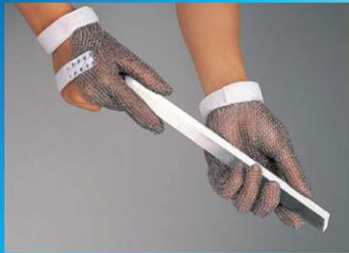
Safety Gloves 安全手袋