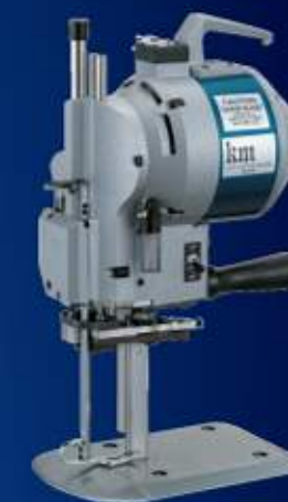
Straight Knife KS-AUV