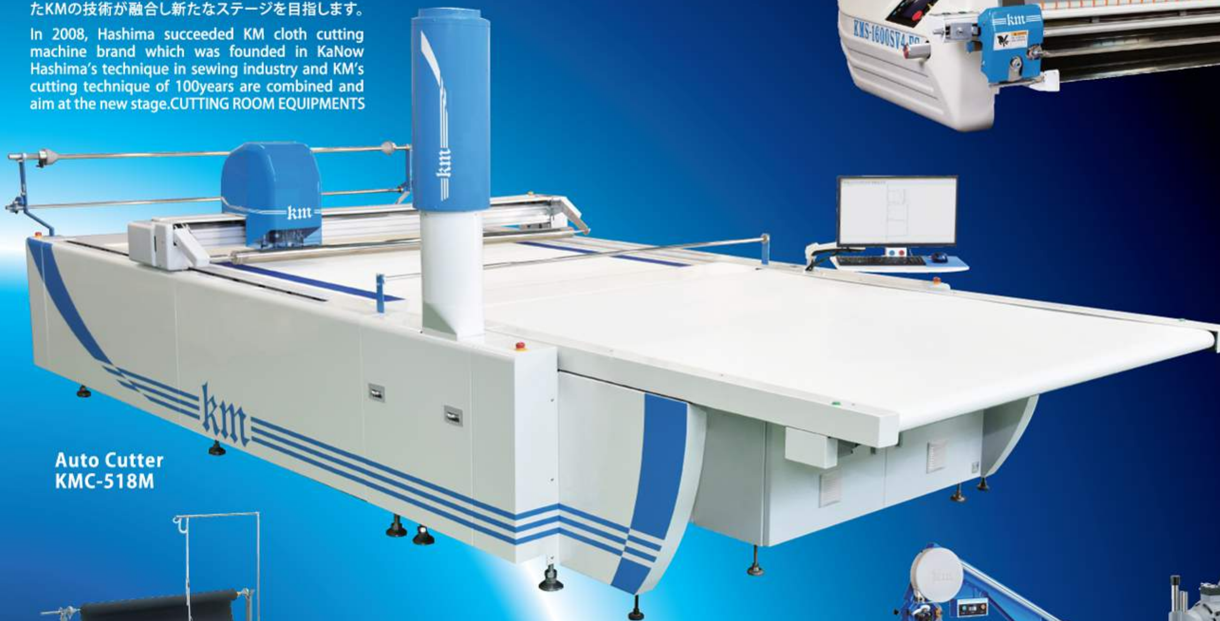
Auto Cutter KMC-518M