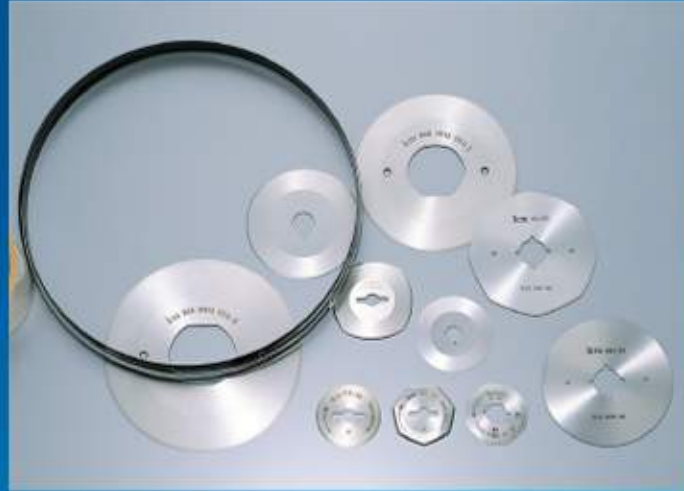
Round and Band Knives 丸刃・バンドナイフ