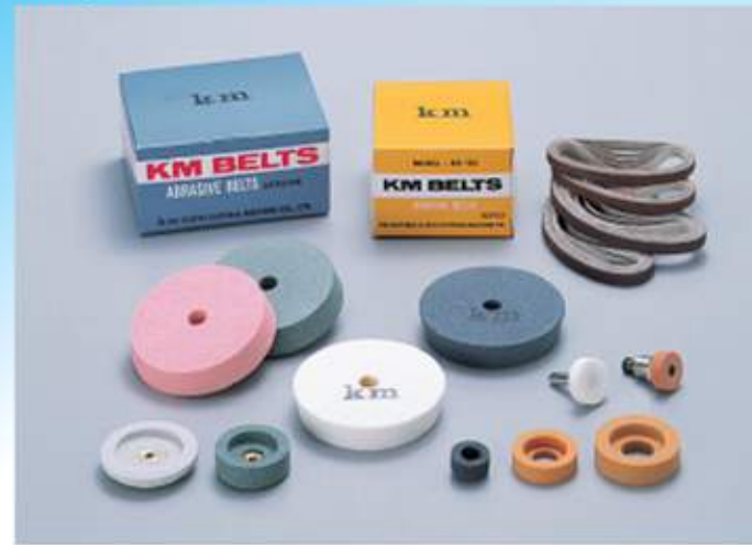
Grinder Parts 研磨関係